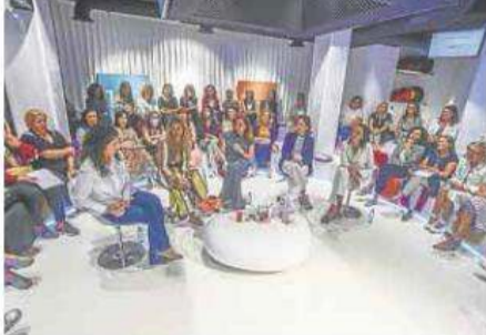
Un momento de la charla en Circus.